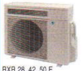
RXR 28, 42, 50 E