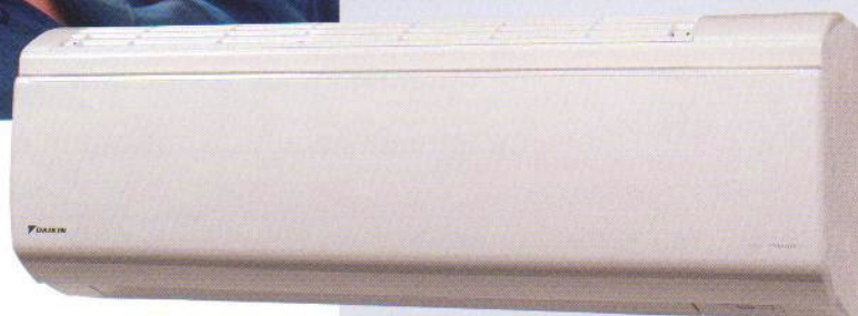
Вътрешно тяло FTXR